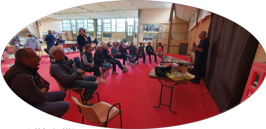
Le 23 Octobre 2024