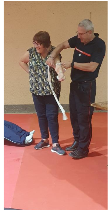
La pose d'un garrot