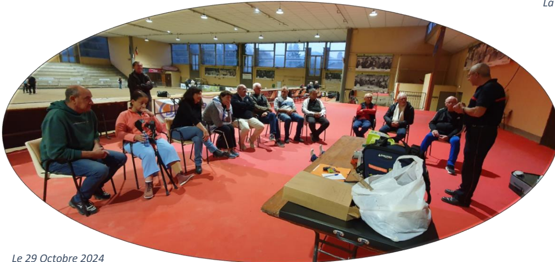
Le 29 Octobre 2024