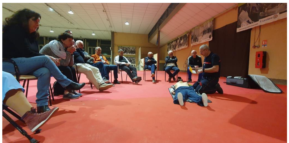
La prise en charge de la victime

Nous voici prêts et rassurés pour une nouvelle ronde d'hiver.